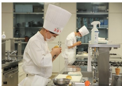
地区大会競技風景