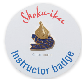
認定登録証・バッジ